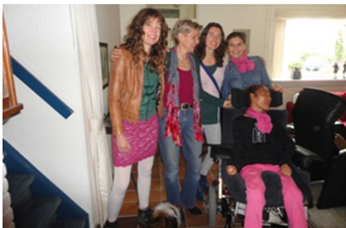
De roze brigade van de RollingStone bij Bonte Buurtgenoten

Samen zelf een buurt ontwikkelen kan een mooi uitgangspunt daarvoor zijn. Collectief Particulier Opdrachtgeverschap helpt bijvoorbeeld om elkaar te leren kennen en gemeenschappelijk op te trekken. http://cpostart.nl/